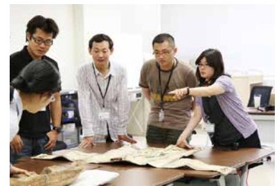
若手研究者の育成