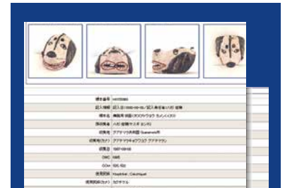
データベースの利用