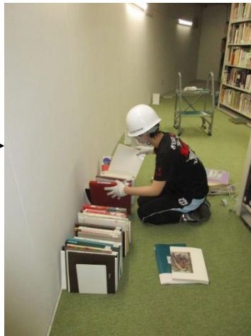
本の背についている請求記号ラベルの順番に並べ替えます。