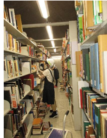
書架に本を戻します。