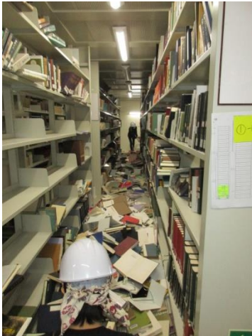
書架の間に図書が散乱して、足の踏み場がないので両端から作業します。

7月17日から20日にかけて国際日本文化研究センター（日文研）の方が2名ずつ4日、7月23日から8月3日にかけて総合地球環境学研究所（地球研）の方が1名ずつ9日手伝いに来てくださっています。現在、8割終了しました。