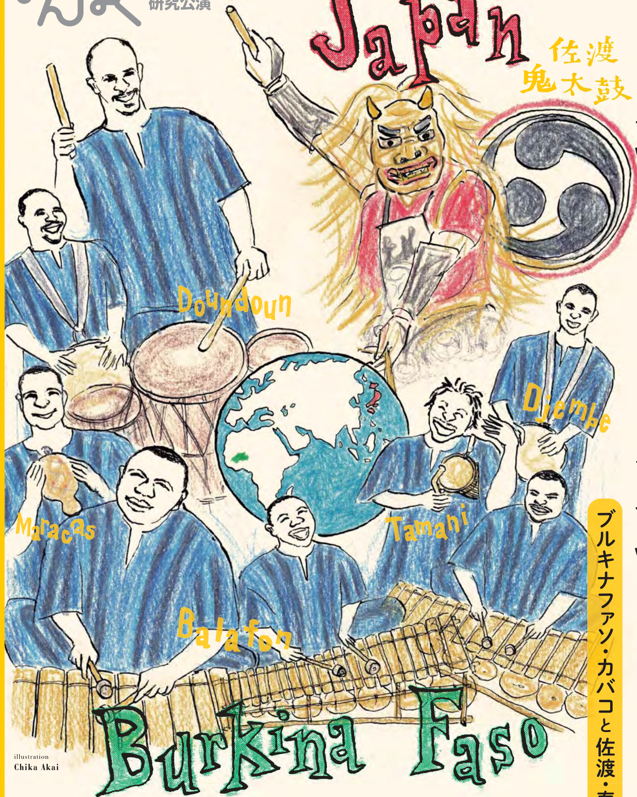
illustration Chika Akai