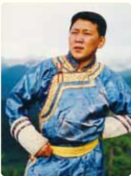
オトクン・ドスタイ