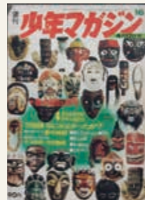
週刊少年マガジン 1970年16号

お祭り広場で開催されたイベント「日本のまつり(2)」の一つ「阿波踊り」。200名の踊り手に観客も加わり、お祭りムードを高めた。