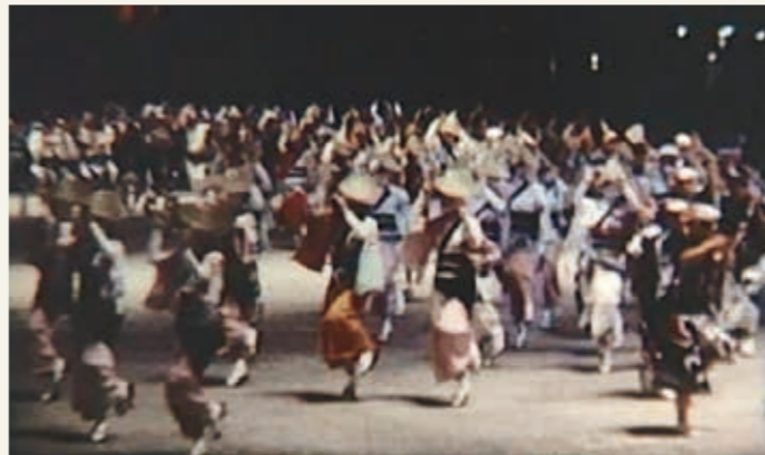
日本万国博覧会催し物記録映像