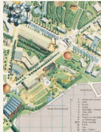
ブリュッセル万博会場の3Dマップ(部分=ベルギー領コンゴ及びルアンダ=ウルンディ区域) 1958年

そこで、北大阪ミュージアム・ネットワークの各館が収蔵する博覧会全般に関する資料や映像を合同で発掘、整備、展示公開し、また来場者から得た1970年万博に関する情報も同時に展示することで、1970年万博の経験者だけでなく未経験者である若い世代の方にもその魅力を感じていただければと思います。