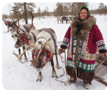
◀色とりどりの文様で飾った衣服

西シベリアでトナカイとともにくらすハンティの人びとは、身の回りの動物や植物、精霊などをあらわした文様で衣服や生活小物をかざります。ハンティの文様を学んで、フェルトのコースターづくりに挑戦しましょう！