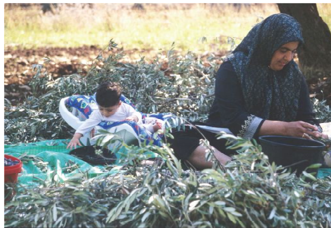
孫の世話をしながら、オリーブの実をつむ女性。あごの下で安全ピンをとめる、もっとも一般的なスカーフ(ヒジャーブ)のかぶり方をしています。

今回のプログラムは、展示場などのオープンスペースで実施しますが、こどもたちの自立心を尊重するために見学席を用意していません。こどもたちのフィールドワーク、成果物制作の手伝いをご遠慮ください。