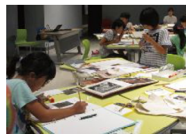
先生の解説を聞いたり、展示場を調査したりしてわかったことを報告書にまとめました。