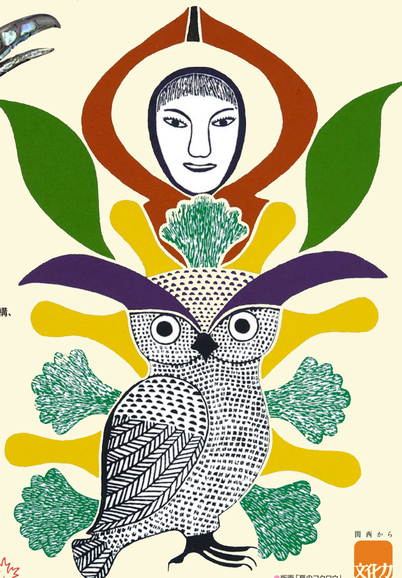
●版画「夏のフクロウ」

主催 国立民族学博物館 共催 朝日新聞社 後援 外務省、カナダ大使館、カナダ観光局、大阪府教育委員会、 吹田市教育委員会、吹田市、日本カナダ学会 協力 カナダ文明博物館、財団法人千里文化財団、日本万国博覧会記念機構、 北海道立北方民族博物館、大阪電気通信大学、関西テレビ放送、 京都造形芸術大学、大阪大学、京都嵯峨芸術大学、 奈良先端科学技術大学院大学、MayuArt.com、スタジオ・セサミ、 J:COM、FM千里83.7、ラジオ大阪1314 協賛 株式会社ISM