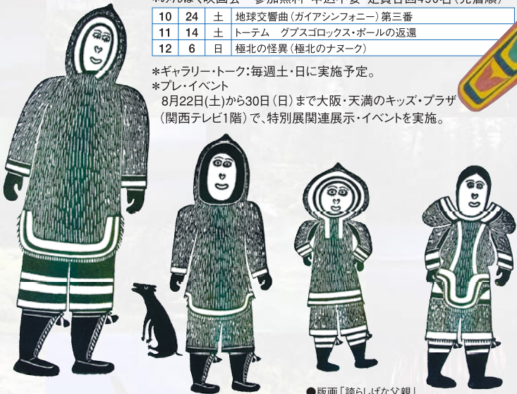
●版画「誇らしげな父親」

8月22日(土)から30日(日)まで大阪・天満のキッズ・プラザ(関西テレビ1階)で、特別展関連展示・イベントを実施。