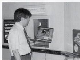
①携帯電話を利用した遠隔授業。ノートパソコン、USBカメラ、ヘッドマイクだけで実施可能