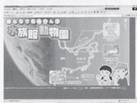
③3つの動物園水族館の獣医師、飼育係、学芸員がWebに動画で登場