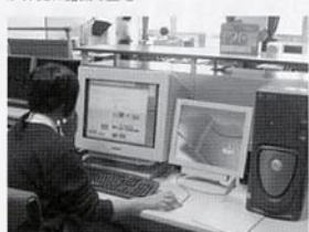
④パソコンのなかにつくった博物館の建築やデザイン作品を各自が共有確認できる

博物館と学校を映像と音声で結んで交流する遠隔授業を実施した。また、遠隔授業をおこなうために、機材整備や講習会、授業の案内をするWebサイトの制作・公開、各博物館の教育プログラムや学習素材を収録したCD-ROM教材の作成・配布、指導案やワークシートをひとつにパッケージ化したプログラム集「学習パッケージ」の作成とWebサイトでの公開、遠隔授業で活用する実物資料を梱包した「デイスカバリーボックス」の制作などをおこなった。また近年は、新しい通信環境として、テレビ電話機能のある携帯電話を使つて、より簡易で機能的な遠隔授業へと発展させている。(写真①)