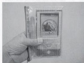
②PDAに、水族館の取材システムをインストールし、LAN経由で生物や施設の情報を入力する