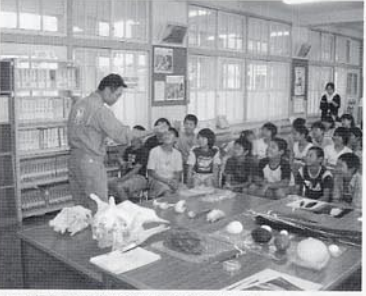
PDAを操作して生物の情報を入手する子どもたち

保護者に連れられ、次は小学校の遠足、そして自分の子どもを連れて行く時である。では博物館は？というところ、「小学校の遠足で二回行っただけ」というのだ。しかも、「遠足博物館」と