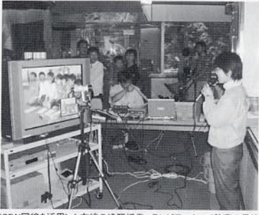
ISDN回線を活用した有線の遠隔授業。テレビモニターで教室の子どもと交流できる

博物館の情報伝達の役割は、館の利用者に対してだけでなく、展示されている資料に対する責任を果たすことでもある。これは特に、海の中道海洋生物科学館のような水族館の場合は、命をもった生物に対する礼として重要である。飼育環境に置かれた