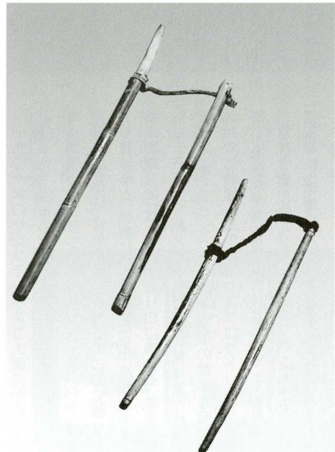
(右)鹿児島島の巻棒

この強烈な体験に味をしめ、一九九八年に「海上の道—鹿児島島の文化の源流を探る—」、二〇〇一年「太鼓は語る—鹿児島とアジアの響き合い—」、そして本年には「樹と竹—列島の文化・北から南から—」という展示会を開いてきた。