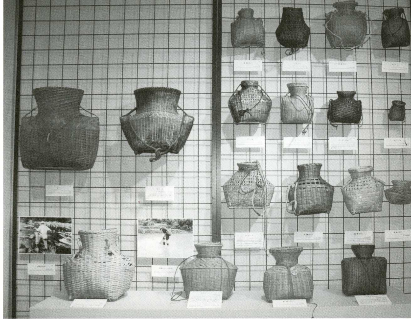
アジアの方形首括(くびくび)れ広口型魚籠(びく)

手前ステージ右3点が鹿児島、左端が喜界島の魚籠。壁面は、中国南部、台湾、フィリピン、インドネシア、ネパールなど、東南アジアの魚籠。その対応は、日本国内のどの地域よりも見事に一致する (黎明館・福島県立博物館共同企画「樹と竹—列島の文化・北から南から—」展)