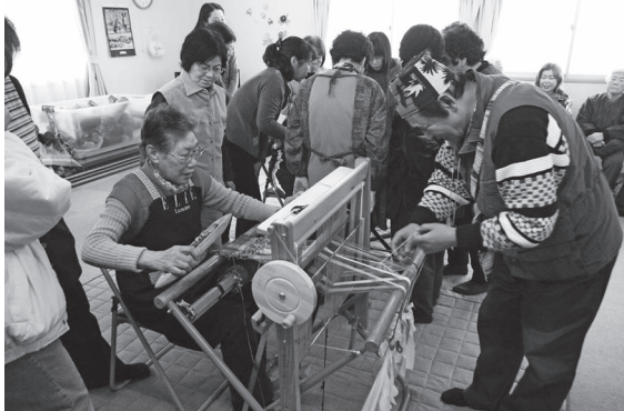
仮設住宅の集会所での心のケアを目的とした、さをり織り普及活動。ひとつの仮設住宅に対し5週連続で実施し、指導者やボランティアが行かなくても活動できる自主活動サークルづくりを支援する