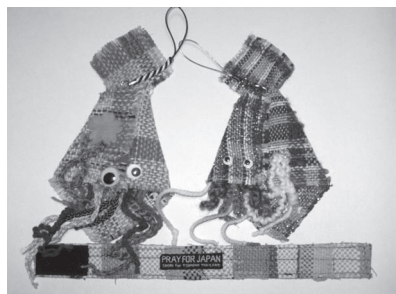
タイの津波被災者たちが日本の復興のために作った「PRAY FOR JAPAN」リストバンドと岩手の津波被災者たちの製品化第一号の「まいっかちゃん」