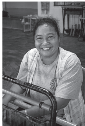
タイの津波被災地のさをり織りの織り手さん