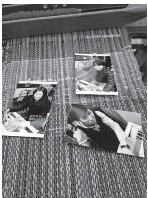
被災者がつくったたて糸にさまざまな人がよこ糸を入れ、携わった人の写真を織り込んでいく。織りつなぎワークショップにて

読者にお勧めしたいことがある。ぜひ、手織りの体験をして欲しい。人間が人間として歴史を重ねて生きていることを体感できるかもしれないから。