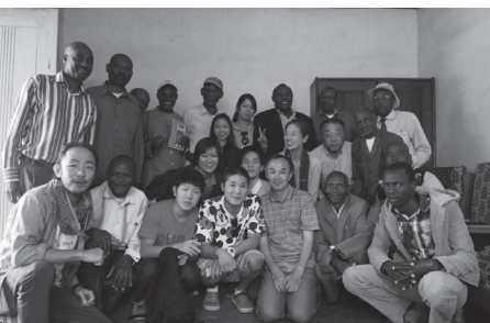
ルカニ農協の役員との記念写真

ルカニ村滞在中、子どもと森林を育む」品質を実感できた参加者は、流通するルカニ村産コーヒーを追いかけるように、街にあるコーヒーの加工・選別工場や競売所へ向かう。そして帰国後も、この愛着あるコーヒーを追いかける参加者が多い。飲み続けるのはもちろん、学生の参加者は学祭やイベントでコーヒーを売り、自家焙煎店やフェアトレード・ショップの参加者は、取扱量を増やしてくれる。そのおかげで二〇一四年初夏、再度一八トンのルカニ村産コーヒーが日本に到着したのである。