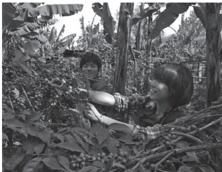
コーヒーの収穫体験