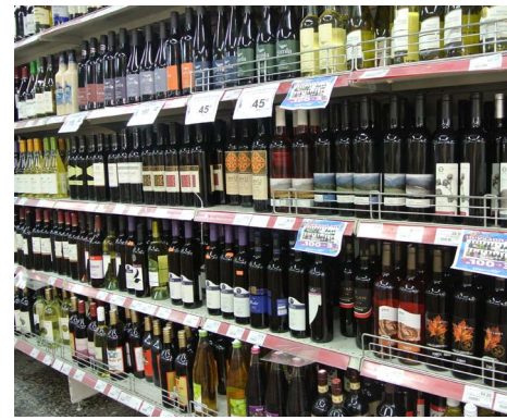
スーパーのワイン売り場。すべてイスラエル・ワイン