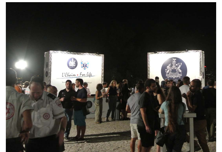
エルサレムで毎夏おこなわれるワイン・フェスティバル

火山灰質・赤砂質・石灰質など水はけの良い土壌が多いうえ、夏季に降雨がなく昼夜の温度差が大きいなどブドウの生育に適しているためか、四国ほどの広さしかないイスラエルに大小三〇〇ほどのワイナリーがある。街のスーパーやワインショップでは多くの国産ワインが並び、一五〇〇円から二〇〇〇円も出せば充分に美味しいワインが手に入る。じつは人が集まっても甘いものとコーヒードですますことの多いユダヤ人にとって、日常的にお酒を飲む習慣はあまりなかった。それでも生産量があがるにつれて、今では食事とワインを楽しむ人が増えている。