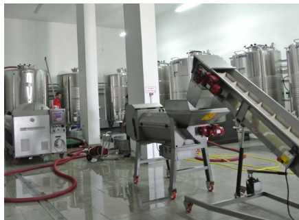
タイベワイナリー。ホテルに隣接した小さなワイナリー

イスラエル産のワインがおいしいならば、パレスチナ産のワインはどうなのだろうか？二〇〇〇年前のパレスチナでは主要な輸出品であったワインも、地域がイスラーム化したことにより廃れ、その後はキリスト教修道院で、品質は二の次の典礼用ワインが細々と生産され続けてきた。それが二〇一三年、満を持してヨルダン川西岸の村タイベに新しいワイナリーが誕生し、嗜好品としてのワイン造りが本格的にはじまった。地元産ブドウを用いて丁寧に造られたパレスチナ・ワインがイスラエル・ワインとともに世界市場で流通する日は、意外に早くやってくるかもしれない。