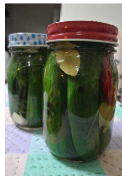
ピクルスの瓶詰め。キュウリのサイズ、塩味/酢味の違いで同じメーカーでもいくつかの種類が市販されている。缶詰も人気