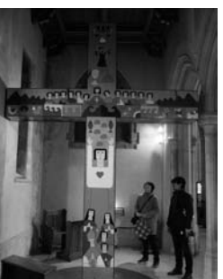
英国の聖ジョージ大聖堂のロメロ・クロス (2016年)

作り、広く信者等に陶板一枚一枚の所有者になるよう寄付を呼びかけた。こうして一九九九年、大聖堂は落成し、ジョルト生涯の大作は完成した。その後文化庁は、大聖堂を含むエリアを二〇〇八年に歴史保護地区に指定し、さらに大聖堂の歴史性や芸術性を評価し、単独で有形文化財として登録しようとした。