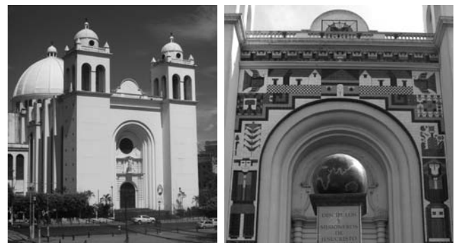
右：大聖堂のファサード（部分）。民家や人びとが描かれる (2007年) 左：すべてが白になった大聖堂 (2016年)

宗教の混合した行為が見られるなどの特徴をもつ。その意味で、白のデザインは原理主義的ですが、ジョルトのデザインこそエルサルバドル的だった。今、白の大聖堂は、芸術家や彼を支持する多くの人のびと、そんな眼差しを受けている。言い換えれば、一見、没個性となった大聖堂は複雑な価値意識を喚起させる文化遺産となったのだ。