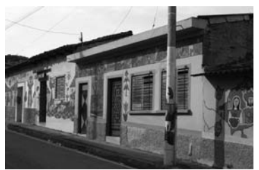
ジョルトが工房を開いた芸術の町 ラ・バルマ 壁も柱もジョルト風 (2007年)

フェルナンド・ジョルトの作品だ。さながら葛飾北斎の浮世絵が日本のイメージとして各所で利用されるように、この国の姿を表現した彼の（または彼に影響を受けた）意匠は至るところでお目にかかる。二〇一三年に国民文化賞を受賞したとき、作品が高く評価されることも、「地図にあらたな点を書き加えた」と長年の功績を讃えられた。彼の芸術は、何もなかったところに工芸品産業を創出し、アートの町を生み出したのだ。