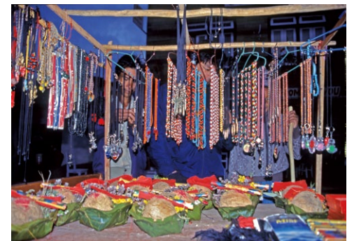
参道で売られている供物と土産物の首飾り(1998年)

の上りと後半の下りで、それぞれカメラを上向きと下向きに固定した映像があるので、構図としては四パタンある。だが、何れもロープウェイのなかと窓からの景色が延々と映し出されることに変わりなく、マナ