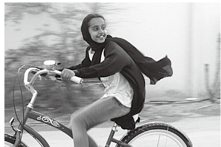
© 2012, Razor Film Produktion GmbH, High Look Group, Rotana Studios All Rights Reserved.

みんなく映画会・第41回ワールドシネマ 「少女は自転車にのって」 明朗活発な10歳の少女ワジダの日常生活や願いをとおして、サウジアラビアにおける女性の状況について考えます。 日時 6月9日(土)13時30分～16時 (13時開場) 会場 本館講堂(定員450名) ※申込不要、要展示観覧券 ※入場整理券を当日11時から本館2階講堂前に配布