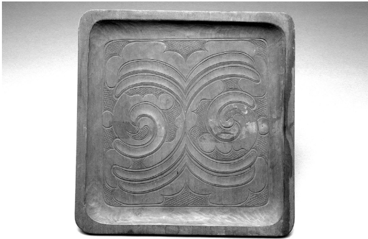
写真1 平取で製作された盆 (標本資料番号K0002158)

だが、当館が所蔵する資料は、設置後に収集されたものばかりではない。本連載でもいくつかの古いコレクションが紹介されてきたところだが、当館で最も古いアイヌの資料が含まれるのは、東京大学理学部人類学教室の旧蔵品である。東大旧蔵の民族学関連資料は六〇〇