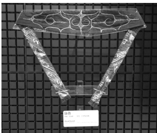
写真2 1884年以前に収集された鉢巻 (標本資料番号K0002270)