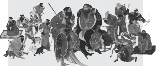
蠣崎波響筆(夷酋列像)、寛政2年(1790)、フランス・プザンソン美術考古博物館所蔵 ※左から4番目の小島雪嶺筆(夷酋列像模本)、天保14年(1843)、個人所蔵

2016年2月25日[木]～5月10日[火] 会場/国立民族学博物館 特別展示館 ◆開館時間/10時～17時(入館は16時30分まで) ◆休館日/水曜日(5月4日(水・祝)は開館)