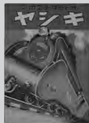
▲ 絵本に描かれた「あじあ号」