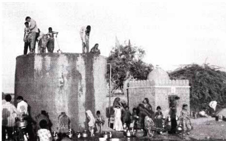
インド、グジャラートのコミュニティ活動

先進国と途上国との間の相違は災害管理システムにある、と多くの人が述べている。先進国の多くには国家および地方レベルの政策、法律、規定、訓練を受けた人材、そして技術的なノウハウがある。これに対して途上国では、技術的なノウハウや土着の知識はあるが、問題はシステムが欠如していることである。しかしながら、国の発展レベルに関係なく、ある共通の要素もある。それは、住民とコミュニティの関わりである。システムや政策、知識や概念はあっても、人々が行動を起こさなければ、災害に強い社会