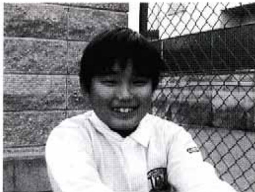
展示ビデオ《Die kindheit in Kobe》より

震災時に胎児か乳児だった子どもへのインタビューである。彼らは、1995年には、この世で生命活動を開始してはいたが、当時のことを覚えてはいない。彼らにあえて震災の記憶を聞く。「そなんん知らん」「赤ちゃんやったからわからへん」。まずはそんな回答がかえってくる。だがよく聞いてみると、彼らは親から、兄弟から