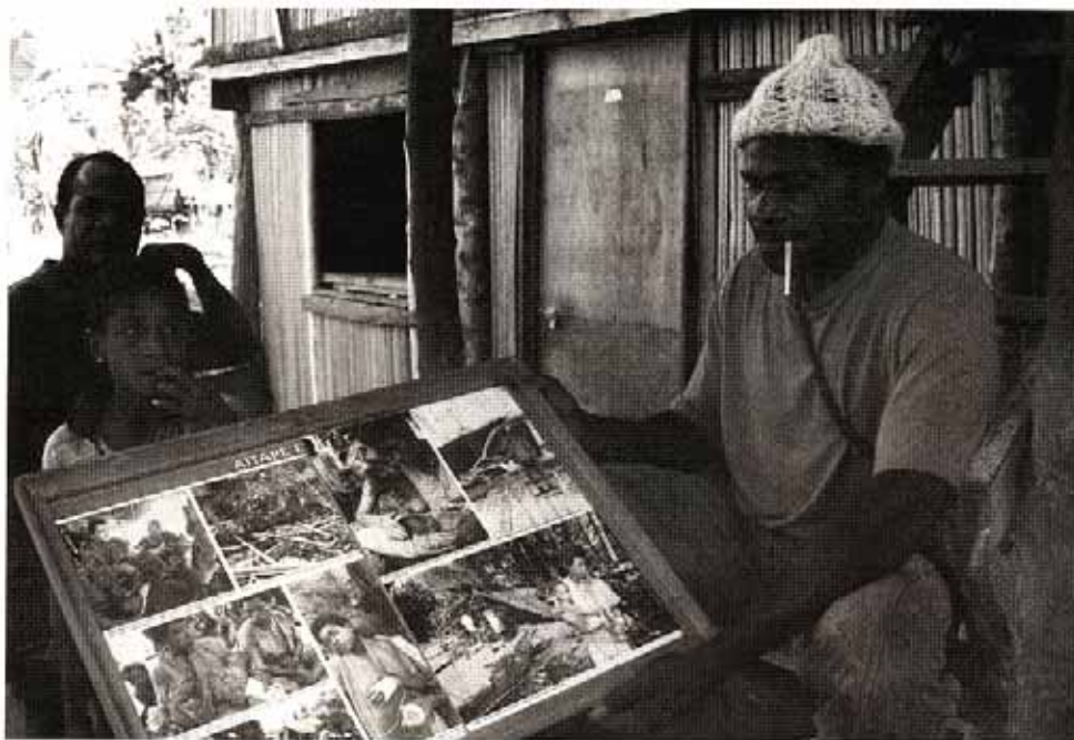
被災地のある村では、津波災害報道写真を額に入れて保存している

記録・記憶化していこうとしているのかを把握し、彼らが被災という経験と「折り合いを付けながら」あるいは「もつれ合いながら」社会生活をおくっているかを理解した時にはじめて、その地域に適した災害対応策を講じることが可