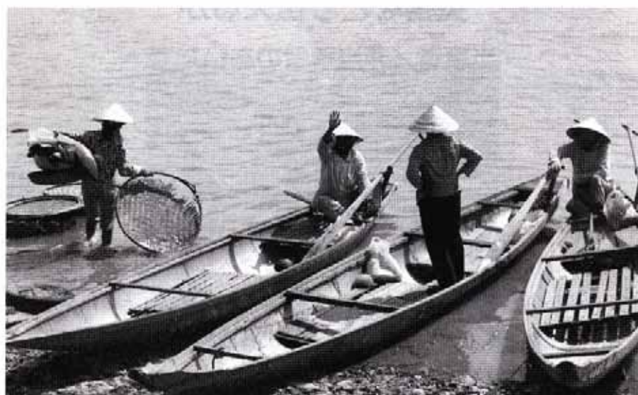
ベトナムでは、洪水も生活の一部