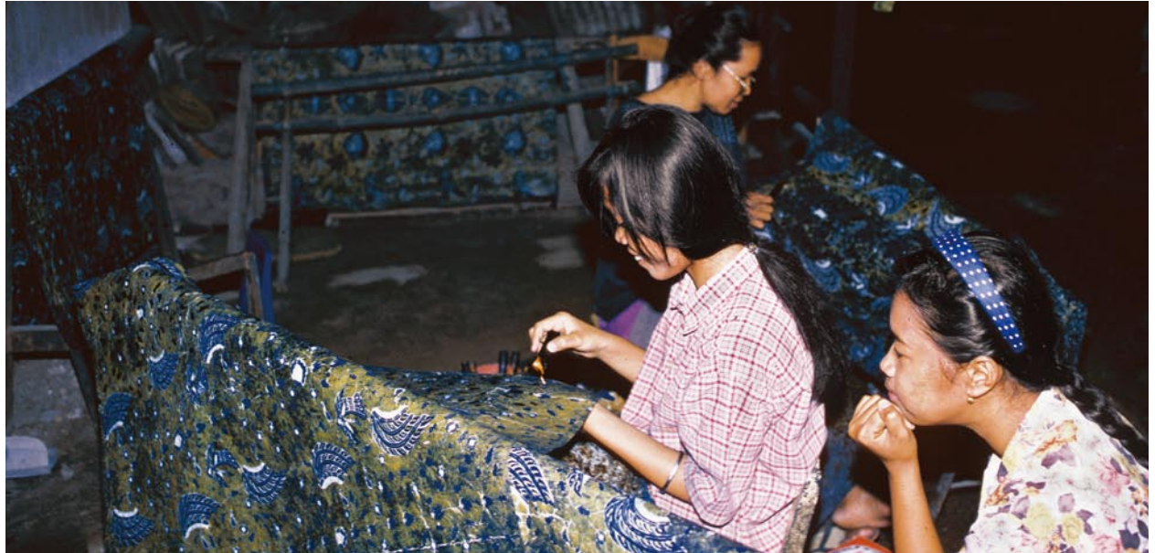
手描きパティックの工房で蠟描きをする女性たち(インドネシア)。

機関研究 ● 「マテリアリティの人間学」領域 布と人間の人類学的研究 (2010-2012)