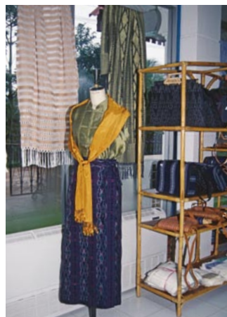
首都の女性会館にある工芸品展示場(ラオス)。

プロジェクト「モノの崇拜」と共に、モノと人との相互関係を考察する。その考察の媒体としてとりあげるのは「布-人」の相互関係である。メンバーはこれまでいずれも、アジアの各地で伝統染織や関連する工芸の研究を行い、個々に研究成果を発表してきた。これらを総合し、布から出発してモノと人の関係を論ずる新たな人類学的領域を築くことに、このプロジェクトの目的がある。布の生産、流通、消費の諸事例を、過去からのつながりや変化に注意しつつ比較検討し、人の身体性、環境規定性、実践的・状況的知識、地域性、人-モノ-人のネットワークなどについて、新しく具体的な知見を生み出すことが目標である。そこでは、人とモノを峻別せず、人自体が物質性・肉体性に根ざしていることに着目する。過剰な人間中心主義、精神や理性の中心主義を批判し、モノと人が相互浸透し融合する世界を描き出すこと、ここに大きな目的がある。