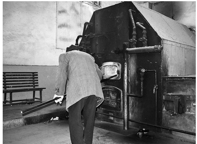
旧式火葬炉を操作する職人（2001年、陝西）。

これまでの研究成果をふまえた上で、2011年度は、①項羽祭祀の伝承と資源化、②エスニックシンボルの創出、③祝祭日の再構築、④中国宗教の市場経済化、⑤宗親会の越境、などから中国のグローバル化の実態のメカニズムを分析する予定である。