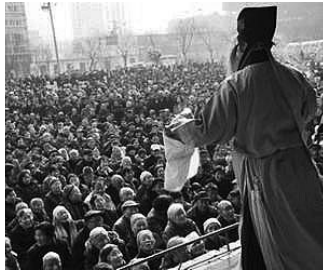
春節時に広場の観客の前で秦腔を演じる俳優（2008年1月23日、西安・長安区）。

また、清水拓野（関西学院大学）の「博物館建設と学校設立にみる演劇文化の再構築過程—陝西地方・秦腔の事例から」の報告によると、経済的基盤の変化や娯楽の多様化の影響を受けて、存続の危機が起きていた秦腔（陝西省、甘粛省、青海省、寧夏回族自治区、新疆ウイグル自治区などの西北地方で行われている古い伝統劇）は、政府主導で無形文化遺産に登録され、「秦腔博物館」の建設によって再活性化しつつある。次世代へ秦腔の文化の伝承が課題として残されているが、政府主導の取り組みとは別に、民間の演劇学校の設立も、秦腔の活性化に一定の役割を果たしている。