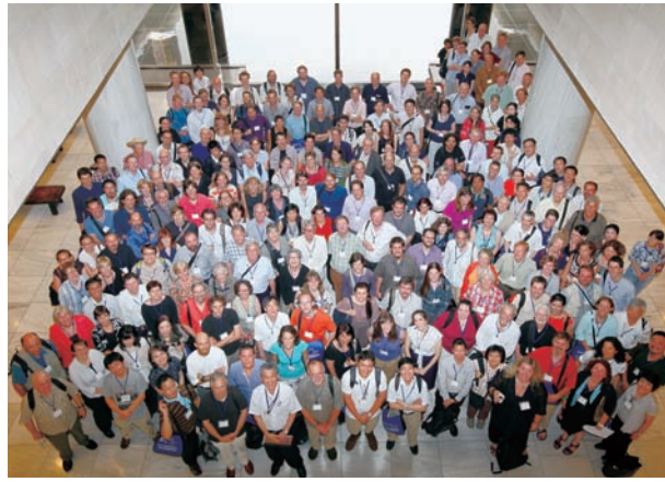
博物館での開催は、大学のキャンパスで行われる会議と施設や環境面で雰囲気異なり、好評を博した。

けでは独立してあらわれない、文法機能を担う語)の語彙的比較再建であることが多かった。これは、そもそも統語論の比較再建という認識がなかったことを推測させる。一方で、さまざまな言語にみられるパターンとその類似点や相違点を調べ、言語をグループ分けする言語類型論の分野では、とくに文法的特徴について、言語にみられるパターンの通時的な変化への関心もたれてきた。言語の類型が時間とともに移り変わってゆく、という考え方は昔からあり、