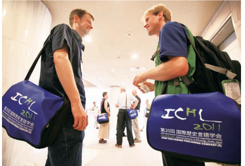
筆のタッチを生かした学会ロゴは、アジア初開催を考慮したものの。豊能障害者労働センターによるデザイン。

た手話の歴史言語学的研究といった最新の研究動向が報告され、共同研究を推進する上で重要な議論の展開をみた。