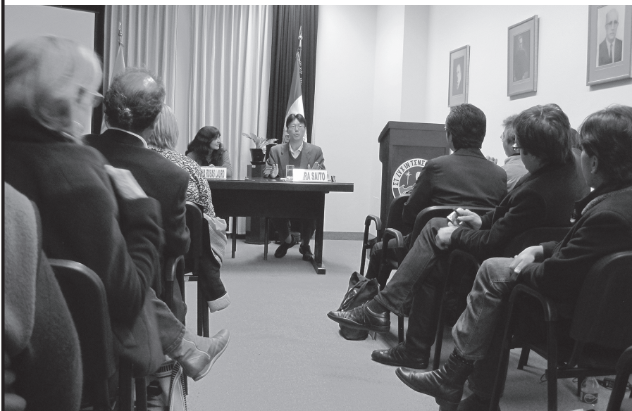
国際シンポジウム「先住民の集住化——比較の視点」の一場面。平成22年9月7日～8日、教皇庁立ペルーカトリカ大学（リマ、ペルー）にて開催。

筆者がペルーで共同研究を立ち上げようとしていたとき、そのような人物に幾度か相談に乗ってもらったことがある。彼はペルー社会全般に人脈を持っており、筆者の先輩にあたる日本人研究者たちと緊密な協力関係を築いていた。実際、彼のアドバイスは的確であり、人物紹介も当を得ていた。しかし、結局筆者は、彼と恒常的な協力関係を結ぶことはなかった。金銭的な見返りを要求されたことがおもな理由だが、個人のつながりではなく機関の協定により研究体制を固めたい、という思いもあった。こ