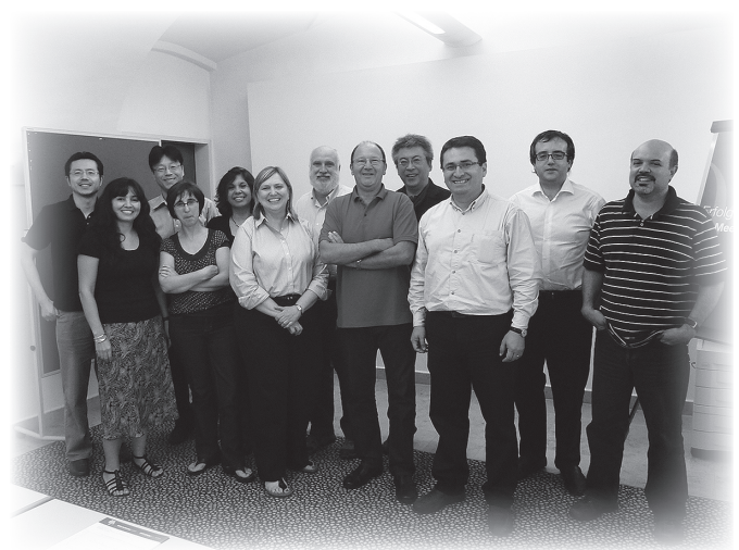
機関研究のメンバー。平成24年7月15日、オーストリア、ウィーンにて。

平成23年度には、米国からアンデス植民地史の専門家を招聘した。平成24年度には、ボリビアからミッション史の専門家、米国からアンデス歴史考古学の専門家を招聘する予定である。