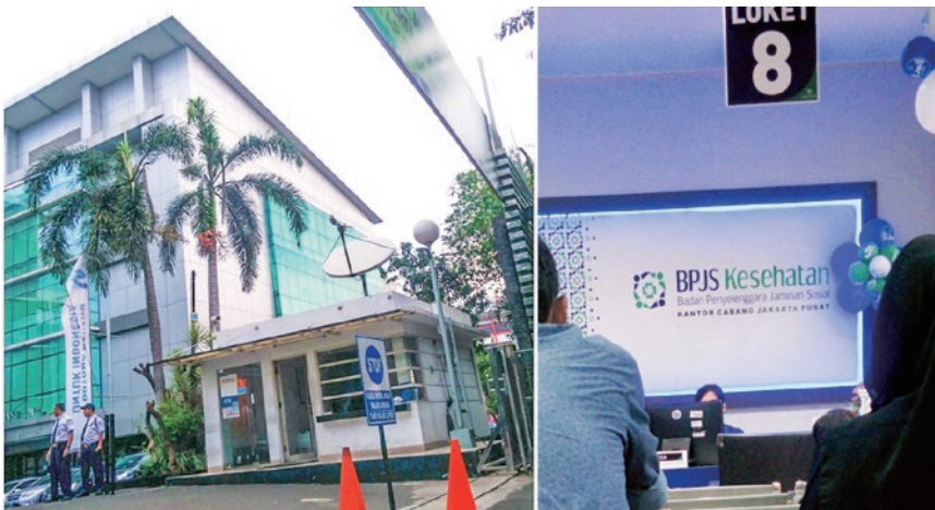
国民健康保険事務所の外観と受付風景(2018年6月、ジャカルタ特別州中央ジャカルタ市)。

協力の下、インドネシアの社会保険制度の導入過程に関する調査を行っている。同国の社会保険制度は、アジア通貨危機によって明らかになった健康リスクや老齡リスクに対応するために整備され、2014年の運用開始以降、加入者を増やしつつある。