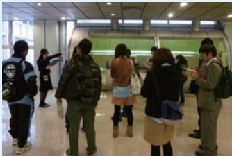
ビデオテーク・電子ガイドの説明

本館が所蔵する映像資料を紹介するビデオテーク、展示資料について映像と音声を使って解説する電子ガイドについてご紹介します。