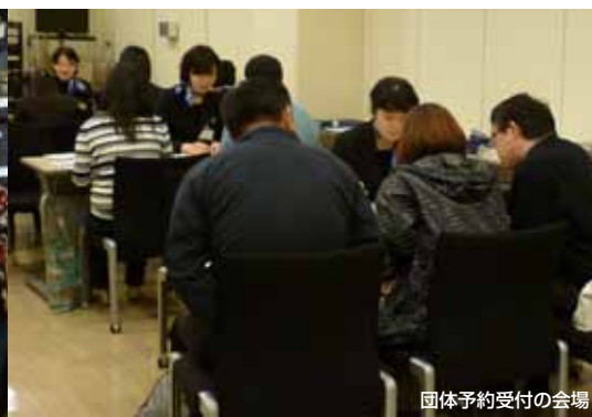
団体予約受付の会場