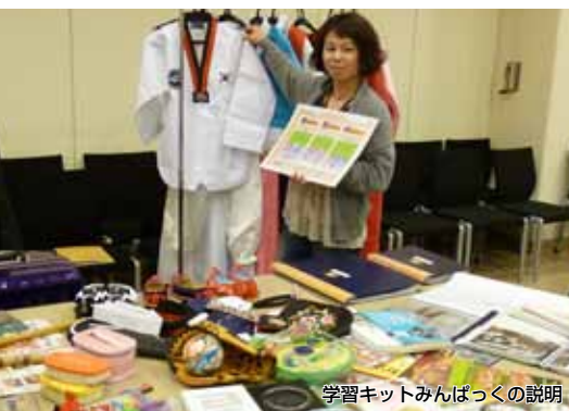
学習キットみんなくの説明

遠足や校外学習など、博物館見学の準備や事前・事後の学習に役立つツールをご紹介します。 さまざまなお相談もお受けいたします。 この機会にぜひ、みんなくへお越しください。