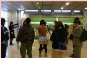
ビデオテーク・電子ガイドの説明

遠足・校外学習でご利用いただける本館の施設(食事・集合場所など)をご案内いたします。また、本館が所蔵する映像資料を紹介するビデオテーク、映像と音声を使って展示資料を解説する電子ガイドについてご紹介します。