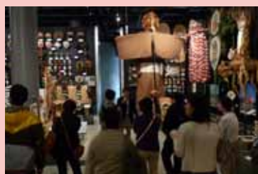
日本の文化展示の説明

今回は、2013年3月に新しくなった日本の文化展示のうち「祭りと芸能」と「日々の暮らし」の概要や見所を、展示を担当した教員がご紹介します。