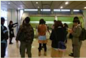
ビデオテーク・電子ガイドの説明

本館が所蔵する映像資料を紹介するビデオテーク、展示資料について映像と音声を使って解説する電子ガイドについてご紹介します。また、当館の施設(食事・集合場所など)をご案内いたします。