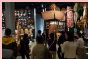
※写真は昨年度の様子

2014年3月に新しくなった本館展示の概要や見所を、展示を担当した研究者がご紹介します。