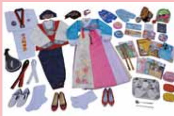
みんなぱく「ソウルのこども時間」

「みんなぱく」は国や地域ごとに、衣装や生活にまつわるさまざまな道具などの実物資料と各種解説をスーツケースにつめ込んだ無料の貸出キットです。現在13種類、22パックを用意しております。また当日は、実際に手にとってご覧になれます。