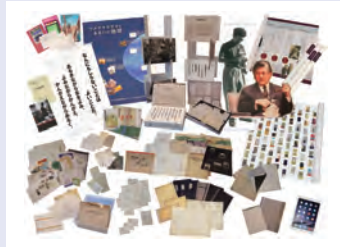
みんぱく「あるく、ウメサオタダオ展」

「みんぱく」は国や地域ごとに、衣装や生活にまつわるさまざまな道具などの実物資料と各種解説をスーツケースにつめ込んだ無料の貸出キットです。当日は、実物を手にとってご覧いただけます。