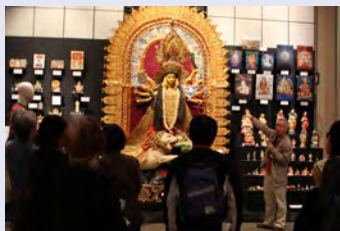
前回のガイダンスの様子

2015年3月に新しくなった本館展示の概要や見所を、展示を担当した研究者がご紹介します。