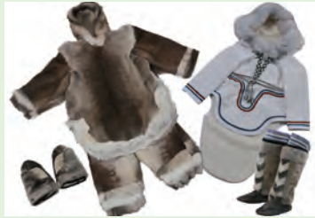
みんぱく「極北を生きる」

「みんぱく」は国や地域ごとに、衣装や生活にまつわるさまざまな道具などの実物資料と各種解説をスーツケースにつめ込んだ無料の貸出キットです。当日は、実物を実際に手にとってご覧いただけます。