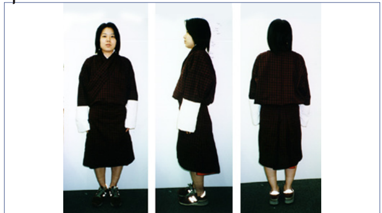
a 上着 〈ゴー〉 b じゅばん 〈デゴ〉 c 帯 〈ケラ〉

ゴーは日本の着物と形がそっくりです。また、チベットの男性用のチュバと同じ形です。ゴーの下にデゴというじゅばんを着て、日本の着物と同じく左前で着ます。そして、そでのところで、デゴと一緒におりかえます。足には長いソックスをはいて、子どもはあまりはきませんが、おとなは靴をはきます。昔ははだしでした。寒くなると、トレーニング・パンツをはいてその上にゴーを着ます。また、暑くなったら、肩の部分でゴーを脱いでしまいます。夏服・冬服の区別はありません。おとなの懐には、小さなおわん、長さ30センチほどの刃、ドマというかみタバコのようなもの、それに弁当入れ（ポンチュ）を入れています。