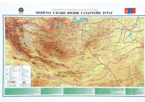
физик газар зүйн зураг