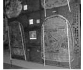
かげえにんぎょう 影絵人形