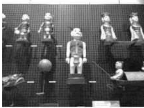
すいじょうにんぎょう 水上人形

東南アジアでは、人形や仮面を用いた芸能がさかんです。この写真の展示物を見つけて、どの国のものが国名を書きましょう。