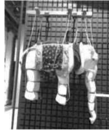
あやつりにんぎょう あやつり人形