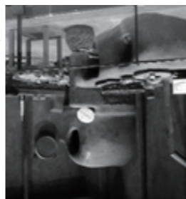
タシユケントの民家の台所を 見てください。 おいしいソーダパンが焼けましたよ。 模様がついています。