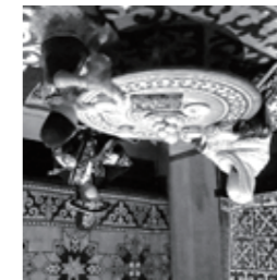
定住家屋の居間です。 「雄ビツツの角」を、 コーナーの模様「雄ビツツの角」を、 完成させましょう。